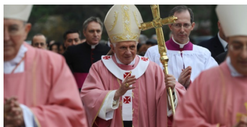
Pape Benoît XVI

« La Station, à Rome, est dans la Basilique de Sainte-Croix-en-Jérusalem, l'une des sept principales de la ville sainte. Élevée au IV e siècle par Constantin, dans la villa de Sessorius, ce qui l'a fait appeler aussi la basilique Sessorienne, elle fut enrichie des plus précieuses reliques par sainte Hélène, qui voulait en faire comme la Jérusalem de Rome. Elle y fit transporter, dans cette pensée, une grande quantité de terre prise sur le mont du Calvaire, et déposa dans ce sanctuaire, entre autres monuments de la Passion du Sauveur, l'inscription qui était placée au-dessus de sa tête pendant qu'il expirait sur la Croix, et qu'on y vénère encore sous le nom du Titre de la Croix. Le nom de Jérusalem attaché à cette basilique, nom qui réveille toutes les espérances du chrétien, puisqu'il rappelle la patrie céleste qui est la véritable Jérusalem dont nous sommes encore exilés, a porté dès l'antiquité les souverains pontifes à la choisir pour la Station d'aujourd'hui. »