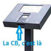
La CB, c'est là